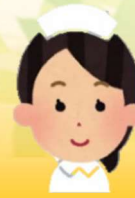
Yさん 第16回研修会参加

10年近くブランクがあり、手技等に不安があり、参加しました。スタッフの方に丁寧・親切に教えて頂いたので、働く自信ができました。